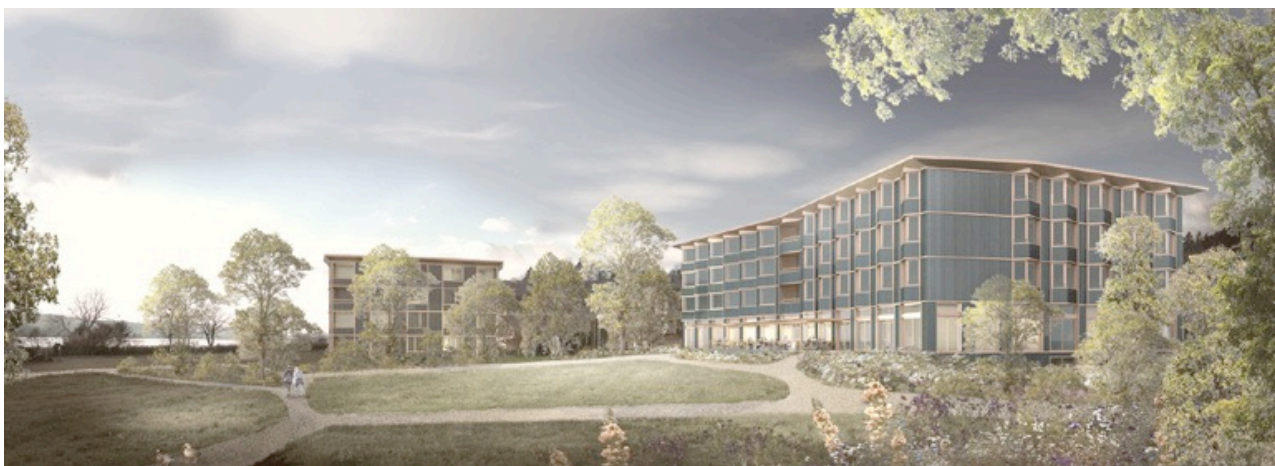
Abbildung: Visualisierung Siegerprojekt PAPILLON

Im Herbst 2021 wurde ein Projektwettbewerb ausgeschrieben. Das Siegerprojekt PAPILLON der ARGE Meier Gadiant, Luzern / Rogger Ambauen AG, Emmenbrücke und vetschpartner Landschaftsarchitekten, Zürich, besticht durch sein klar strukturiertes und pragmatisches Projekt und bietet unverändert Platz für 60 Pflegebetten. Dazu kommen zwei Notfall- und Ferienbetten. Im Neubau soll neu auch die Spitex Sempach und Umgebung integriert werden. Dank der Positionierung des Neubaus parallel zur Kantonsstrasse besteht die Möglichkeit, in einer späteren Phase die Anlage gegen Westen bedarfsgerecht, zum Beispiel für betreutes Wohnen, zu erweitern.